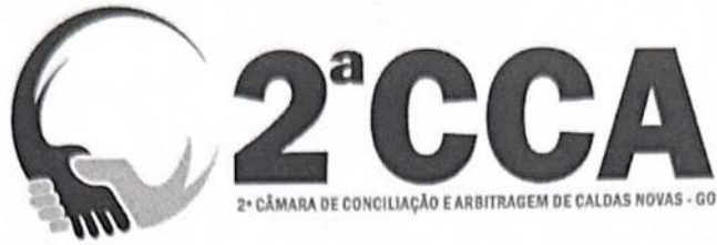
TABELA DE CUSTAS - ANEXO 2