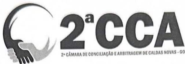
TABELA DE CUSTAS